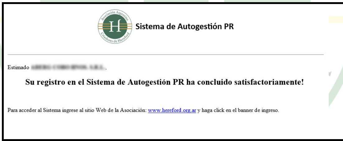
Imagen 3 – Correo recibido que confirma la finalización del registro

Si ha realizado todos los pasos correctamente, recibirá automáticamente un nuevo e-mail ( Imagen 3 ) con la confirmación.