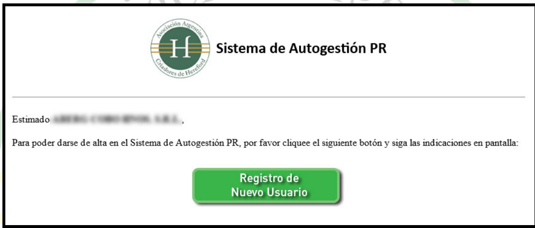
Imagen 1 – Correo que recibirá en su casilla para comenzar el registro.

En esa casilla, será donde reciba el "Formulario de Registro" (Imagen 1)