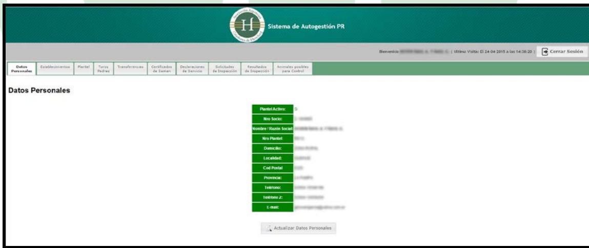
Imagen 5 – Pantalla principal del Sistema

Aparecerá entonces en pantalla el Menú Principal del Sistema a partir del cual accederá a todas las operaciones disponibles ( Imagen 5 ).